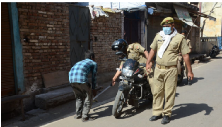
Un policía golpea con un palo a un hombre por saltarse el confinamiento obligatorio impuesto en India.

El coronavirus agrava la represión en el mundo: más violencia en la calle y plenos poderes para los gobiernos