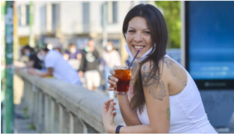
Una joven toma un aperitivo en la dársena de Milán.

El norte de Italia se rebela: los milaneses salen en masa a tomar el aperitivo. La provincia de Alto Adigio ignora la orden del Gobierno y reabre sus negocios.