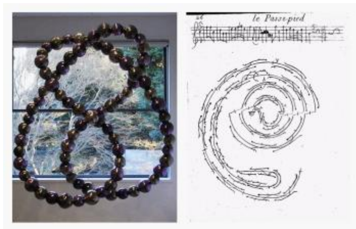
La escultura de Othoniel frente a las notaciones de baile de Feuillet

Othoniel, que trabajó en estrecha colaboración con el arquitecto paisajista Louis Benech se inspiró para la nueva fuente de Versalles en el propio libro de instrucciones de baile de Louis XIV. En un volumen que contiene anotaciones manuales para danzas barrocas, el artista de 51 años, conocido por sus esculturas a gran escala de orbes de vidrio enredados, vio una imagen que se parecía a su propio trabajo. Luego reinterpretó las notas, trabajando con sopladores de vidrio en Basilea, Suiza, para hacer las grandes cuentas de oro y vidrio azul para Les Belles Dances. Se aplicó pan de oro a cada cuenta de vidrio a mano, se glaseó y se selló, un proceso que tomaría cinco días para cada cuenta. Para la instalación en Versalles, cada cuenta debía ajustarse a mano para asegurarse de que la trayectoria del agua siguiera las curvas de la escultura.